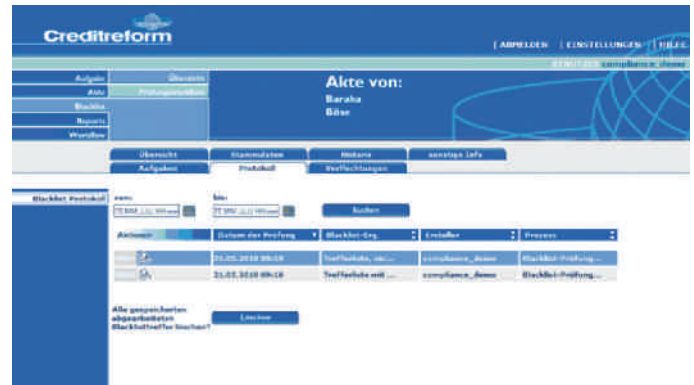
Benutzeroberfläche der CrefoSystem Weblösung

Per Browser gleichen Sie über die CrefoSystem Weblösung Geschäftskontakte gegen alle relevanten Sanktionslisten ab. Dabei erhalten Sie das Prüfungsergebnis immer direkt.